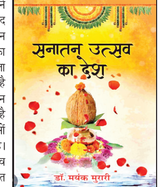
सनातन उत्सव का देश