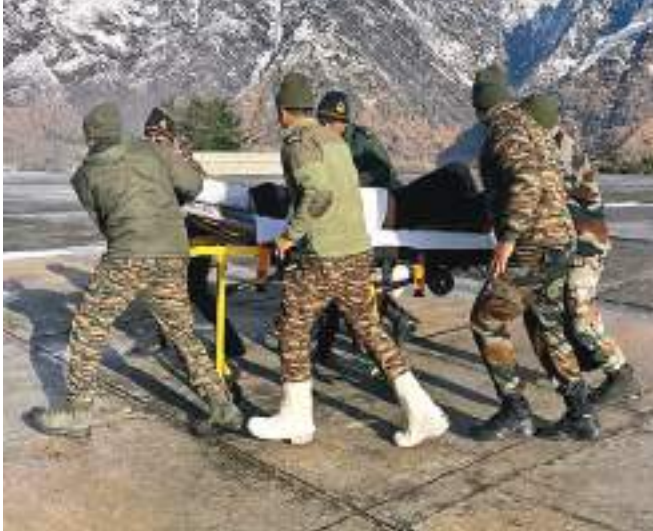
लेफ्टिनेंट जनरल अनिंद सेन गुप्ता और जीओसी उत्तर भारत क्षेत्र लेफ्टिनेंट जनरल डीजी मिश्रा हिमस्खलन क्षेत्र में चल रहे खोज और

एजेण्टी देहरादून। उत्तराखंड के चमोली जिले के माणा क्षेत्र में हुए हिमस्खलन में रेस्क्यू अभियान अभी भी जारी है। सेना के आधिकारिक बयान में कहा गया है कि इस हिमस्खलन में फंसे 55 श्रमिकों में से 50 को निकाला गया है, जिसमें चार की मौत हो गयी, जबकि पांच श्रमिकों की तलाश अभी जारी है। चमोली जिले के माणा क्षेत्र में हाई-वे चौड़ीकरण के दौरान 55 श्रमिक शुक्रवार को हिमस्खलन की चपेट में आ गए थे। हादसे के बाद से ही रेस्क्यू अभियान जारी है और शनिवार सुबह हिमस्खलन में फंसे 55 श्रमिकों में से 50 का रेस्क्यू किया गया। इसमें से चार श्रमिकों की मौत की पुष्टि की है। मध्य कमान के जीओसी-इन-सी