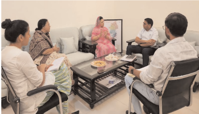
प्रशिक्षित हो और घर-घर जाकर लोगों को पीएम सूर्य घर मुफ्त बिजली योजना में लाभान्वित करें जिससे न सिर्फ इन महिलाओं का सर्वाधिकरण हो

राजसमंद। सांसद श्रीमती महिमा कुमारी मेवाड़ ने प्रधानमंत्री सूर्य घर मुफ्त बिजली योजना में संसदीय क्षेत्र को अग्रणी लाने और अधिकाधिक लोगों को इस योजना में लाभान्वित करने हेतु प्रयास शुरू कर दिए हैं सांसद ने गुरुवार को अपने कार्यालय में जिला कलेक्टर श्री बालमुकुंद असावा, स्वनिधि फाउंडेशन के प्रतिनिधियों के साथ योजना के क्रियान्वयन को लेकर चर्चा की और इसके पश्चात एवीबीएनएल एवं भाजपा मण्डल अध्यक्षों के साथ इस योजना के व्यापक प्रचार-प्रसार, चुनौतियों के समाधान और उपायों पर चर्चा की। इस दौरान स्वनिधि फाउंडेशन के पदाधिकारी उपस्थित रहे जिन्होंने योजना में लोगों को जोड़ने के लिए कई सुझाव दिए। सांसद ने कहा कि क्यों न ड्रोन सखी की तर्ज पर जिले में सोलर सखी तैयार हो। ये सोलर सखी महिलाएं