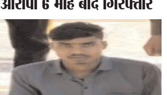
● पदमावत मीडिया