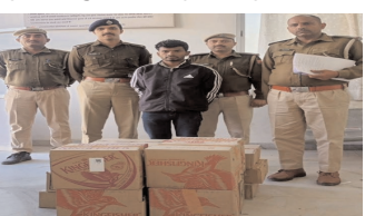
● पदमावत मीडिया

17 पेटी अंग्रेजी शराब के साथ एक गिरफ्तार