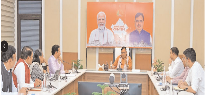
के सभी क्षेत्र मेट्रो से कनेक्ट हो। मुख्यमंत्री ने फेज- 2 के अंतर्गत सीतापुरा से अंबाबाड़ी तक मेट्रो

जयपुर । मुख्यमंत्री भजनलाल शर्मा ने सीतापुरा (गोनेर मोड़) से अंबाबाड़ी (टोडी मोड़) तक प्रस्तावित मेट्रो कॉरिडोर (फेज-2) की विस्तृत परियोजना रिपोर्ट (डीपीआर) का कार्य 31 मार्च, 2025 तक पूरा करने के निर्देश दिए हैं। उन्होंने कहा कि कॉरिडोर के सिविल कार्यों के टेंडर 15 अगस्त से पहले जारी हो और परियोजना का समयबद्ध क्रियान्वयन सुनिश्चित किया जाए। शर्मा मंगलवार को मुख्यमंत्री निवास पर मेट्रो अलाइमेंट के संबंध में आयोजित बैठक की अध्यक्षता कर रहे थे। उन्होंने कहा कि राज्य सरकार जयपुर में मेट्रो सेवा के विस्तार पर गंभीरता से कार्य कर रही है। हमारी मंशा है कि भविष्य के आवश्यकता को देखते हुए जयपुर