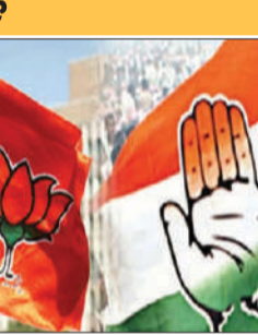
हिंदी को थोपे जाने के खिलाफ आवाज उठाई है और अब उतरी राज्यों से भी ऐसे समर्थन मिल रहा है।

जिस तरह से बीजेपी हिंदी भाषा को थोपकर जनाधार खड़ करना चाहती है, वह सही नहीं है, आप उन पर हिंदी नहीं थोप सकते हैं। बता दें कि तमिलनाडु के सीएम स्टालिन ने कहा था कि केंद्र सरकार स्कूली छात्रों के लिए धन मुहैया कराने के लिए त्रिभाषा नीति लागू कर रही है, लेकिन तमिलनाडु ने अपनी सफलता के लिए दो-भाषा नीति को अपनाया है। सीएम ने कहा कि तमिलनाडु ने अपनी मातृभाषा तमिल के साथ-साथ अंग्रेजी को तरजीह दी है, हिंदी की बजाय अंग्रेजी को अपनाकर राज्य ने दुनिया से संबद्ध स्थापित किया है। उन्होंने कहा कि तमिलनाडु ने