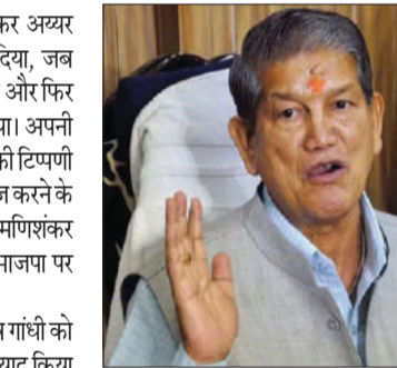
उन्होंने अर्थव्यवस्था के उदारीकरण के लिए पी ट्रेस कदम उठाए। यह दुर्भाग्यपूर्ण है कि पार्टी (कांग्रेस) का एक वर्ग उनके साथ खड़ नहीं हुआ, वकना देश का इतिहास कुछ और होता। नेता प्रतिपक्ष के रूप में उनके भाषण आज भी नेताओं का मार्गदर्शन करते हैं।

नई दिल्ली (एजेंसी)। वरिष्ठ कांग्रेस नेता मणिशंकर अय्यर की टिप्पणी ने बुधवार को एक नया विवाद खड़ कर दिया, जब उन्होंने पूर्व प्रधान मंत्री राजीव गांधी को पहले कैम्ब्रिज में और फिर इंग्लैंड के कॉलेज में दो बार शिक्षाविदों में असफल बताया। अपनी ही पार्टी के प्रधान मंत्री की आलोचना करने वाले अय्यर की टिप्पणी ने सत्तारूढ़ भाजपा को सबसे पुरानी पार्टी पर हमलों को तेज करने के लिए नया हथियार दे दिया है। हालांकि, अब कांग्रेस मणिशंकर अय्यर के इस बयान के बाद सफाई में आ गई है और भाजपा पर निशाना भी साथ रही है।