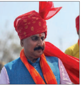
राजनीतिक विवाद और प्रतिक्रियाएं