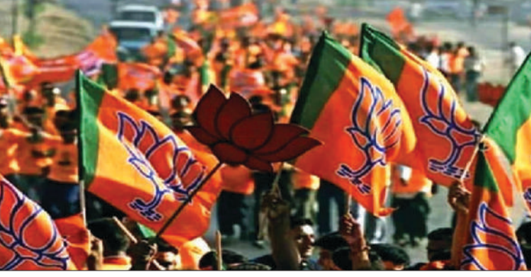
प्रकार, पांच सालों में प्रत्येक महिला को कुल 90 हजार रुपये का सहयोग मिलेगा, जिससे राज्य की आर्थिक गतिविधियों में लगभग 33 हजार करोड़ रुपये का संचार होगा। इस नए फॉर्मूले के तहत

असम में भाजपा के अध्यक्ष दिलीप सैकिया ने कहा कि राज्य में लगभग 4 लाख स्वयं सहायता समूह हैं, जिनमें प्रत्येक समूह में 10 महिलाएं चुड़ी हैं। इस प्रकार कुल 40 लाख महिलाएं इससे लाभान्वित हो सकती हैं। उन्होंने बताया कि भाजपा सरकार हर महिला को सालाना 10 हजार रुपये की आर्थिक मदद देगी, जिससे उनका कारोबार बढ़ सके। अगले साल यह राशि 20 हजार रुपये कर दी जाएगी, जिसमें 10 हजार रुपये का लोन होगा, जिसे सस्ती ब्याज दरों पर चुकाना होगा, जबकि शेष 10 हजार रुपये सरकार की ओर से दिए जाएंगे। इस