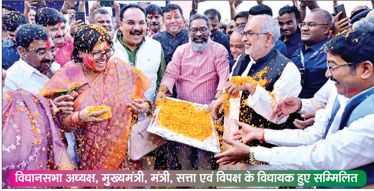
विधानसभा अध्यक्ष, मुख्यमंत्री, मंत्री, सत्ता एवं विपक्ष के विधायक हुए सम्मिलित

प्रातः नागपुरी संवाददाता रांची। झारखंड विधानसभा के द्वितीय (बजट) सत्र के आज की कार्यवाही खत्म होने के बाद झारखंड विधानसभा परिसर में होली मिलन समारोह का आयोजन 11 मार्च को किया गया। इस समारोह में विधानसभा अध्यक्ष रबीन्द्रनाथ महतो, मुख्यमंत्री हेमन्त सोरेन सहित अन्य मंत्री और सत्ता पक्ष एवं विपक्ष के विधायक उपस्थित रहे। इस अवसर पर सभी ने एक-दूसरे पर फूलों की बारिश की। अबीर-गुलाल लगाकर पवित्र त्योहार की हार्दिक बधाई एवं शुभकामनाएं दीं। इस अवसर पर मुख्यमंत्री ने समस्त झारखंडवासियों को पवित्र त्योहार होली की हार्दिक बधाई