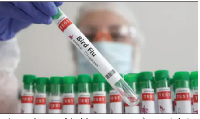
वायरस के कुछ सबसे खराब लक्षणों के बारे में भी जानकारी दी है, जिनमें गंभीर खांसी, लगातार सर्दी और सबसे खतरनाक नाक से खून आना शामिल है। यदि किसी को भी इन लक्षणों का अनुभव होता है तो वह तुरंत डॉक्टर

चंडीगढ़, (एजेंसी)। केंद्र सरकार के डेयरी एवं पशुपालन विभाग ने तत्काल प्रभाव से पंजाब में बर्ड फ्लू का अलर्ट जारी किया है। ये अलर्ट पंजाब के अलावा 9 अन्य राज्यों में भी जारी किया है। सूत्रों के मुताबिक यह फ्लू लगातार बढ़ते खतरे और घातक एच5एन1 वायरस के फैलने के खतरे को देखते हुए जारी किया है। मीडिया रिपोर्टों में सूत्रों के हवाले से बताया गया है कि केंद्र सरकार के डेयरी और पशुपालन विभाग ने चेतावनी दी है कि बीमारों वाला चिकन खाने से कोई भी व्यक्ति इस घातक वायरस की चपेट में आ सकता है। इसलिए चिकन खाने वालों को सतर्क रहने की सलाह दी है। इतना ही नहीं, स्वास्थ्य विशेषज्ञों ने इस