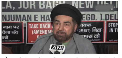
और मंदिरों में हजारों टन सोना-चांदी है। इसे गरीबों में क्यों नहीं बांटा जा रहा? इन मंदिरों में इतना सोना है कि अगर इसे बाँट दिया जाए तो हर गरीब हिंदू अमीर बन जाएगा। दूसरी बात ये कि अगर ये सोना वापस रिजर्व बैंक में चला जाए तो डॉलर 20 रुपये पर आ जाएगा और महंगाई खत्म हो जाएगी।