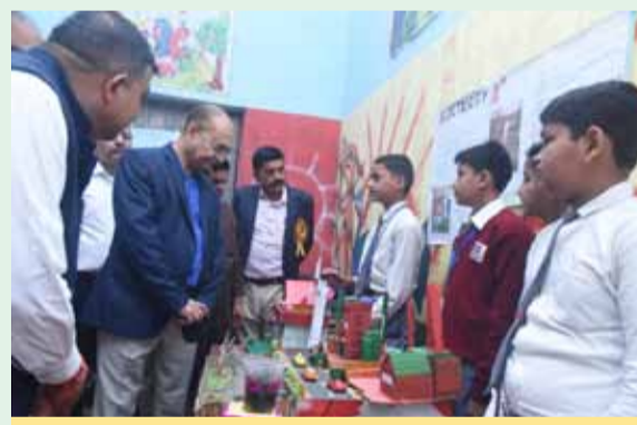
बच्चों के बनाये मॉडल को देखते कुलपति

छपरा।शहर के गाँधी चौक स्थित संस्कृति द मॉडल स्कूल के प्रांगण में विज्ञान प्रदर्शनी, व्यंजन मेला सह प्रतिभा सम्मान समारोह का आयोजन किया गया।