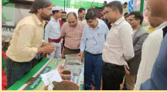
प्रदर्शनी का अवलोकन करते जिलाधिकारी

जानकारी दी। उनके उत्कृष्ट जैविक उत्पादों को देखकर कृषि विशेषज्ञों और किसानों ने भी गहरी रुचि