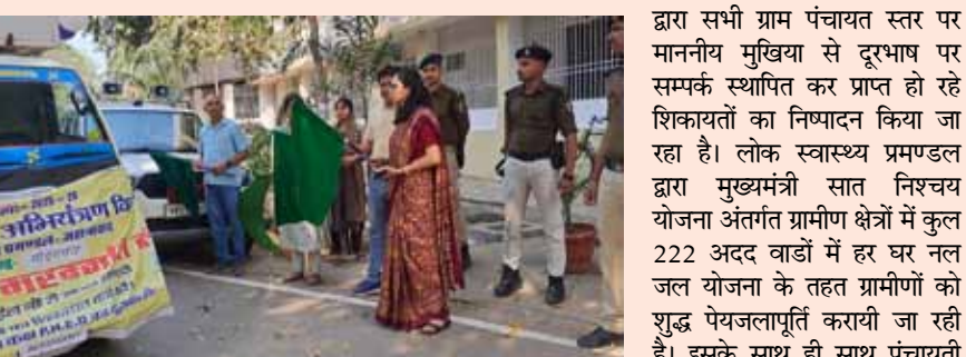
नई सोच एक्सप्रेस

जहानाबाद। लोक स्वास्थ्य अभियंत्रण विभाग की ओर से पूरे जिले में आसन्न गर्मी के मौसम को देखते हुए सभी सरकारी चापाकलों की मरम्मत हेतु कुल 07 टीमों को जिले के विभिन्न प्रखंडों के लिए रवाना किया गया। जिलाधिकारी अलंकृता पांडेय द्वारा हरी झंडी दिखाकर सभी 07 चलंत मरम्मत दल को रवाना किया गया। इस अवसर पर प्रेस को संबोधित करते हुए जिलाधिकारी ने कहा कि आगामी गर्मी के मौसम के दृष्टिगत तथा गर्मी के मौसम में विशेषकर जलस्तर के गिरने की चोर समस्या होती है। जिससे ग्रामीण क्षेत्रों में पेय जल की समस्या उत्पन्न हो जाती है। इसी को ध्यान में रखकर चलंत मरम्मत दलों को रवाना किया जा रहा है। कार्यक्रम अंतिमता, पीएचईडी द्वारा आमजनों की सुविधा