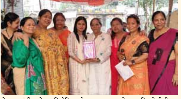
नई सोच एक्सप्रेस

» मुद्रा योग पीठ फाउंडेशन के इस आयोजन पर सैकड़ों महिलाएं हुई शामिल