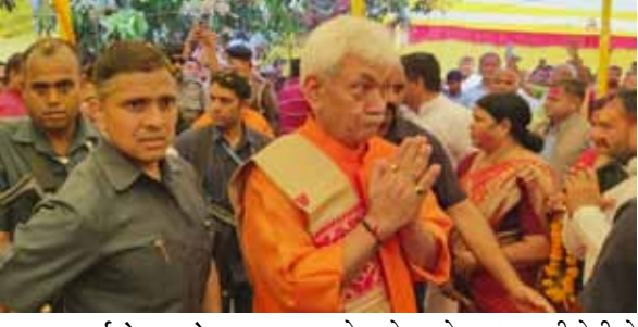
नई सोच एक्सप्रेस

जहानाबाद। जिले के संघवा गांव में आयोजित होली मिलन समारोह में जम्मू-कश्मीर के माननीय उपराज्यपाल मनोज सिन्हा सम्मिलित हुए। इस अवसर पर भाजपा, जदयू बिरंच का भी जिक्र किया। उन्होंने मजाकिया लहजे में कहा कि मगध क्षेत्र में एक घंटा बिताने के बावजूद बिरंच न मिलने से आश्चर्य हो रहा है। जिस सुनकर कार्यक्रम में उपस्थित लोगों ने जोरदार तालियां बजायीं। माननीय उपराज्यपाल मनोज सिन्हा ने लगभग एक घंटा संघवा गांव में बिताया। जहां उन्होंने स्थानीय लोगों से बातचीत की और क्षेत्र के विकास को लेकर चर्चा की।